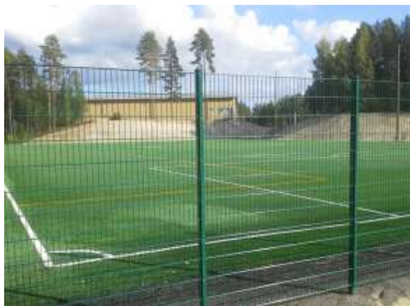
Joutsan kenttä kesällä 2013

Olosuhdeteko – tunnustuksella tullaan huomioimaan merkittäviä hankkeita tai investointeja jalkapallokenttien tai futsalsalien rakentamisessa ja olosuhteiden kehittämisessä.