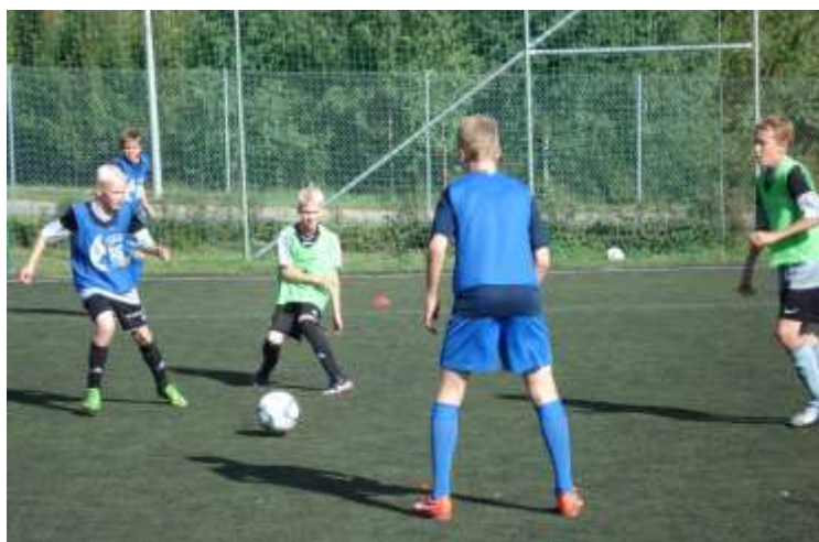
Talenttiryhmä harjoituksissa Vehkalammella.